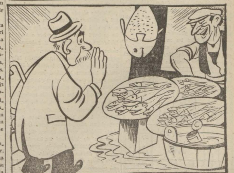
— Al bey baba, şu balıktan bir kilo al! — Aman evlâdım, 40 lira maşlı adamım, sonra dedi kodu olur!

İstanbul Üniversitesi Hukuk Fa-kültesi dekanı Ord. Prof. Ali Fuad Başıgil, dün akşam Eminönü Halkevinde kalabalık bir gençlik kütle-sinin âläka ile dinlediği mühim bir konferans vermiştir. «Halkın yük-sek tahsil gençliğinden bekledek-vinde kalabalık bir gençlik kütle-si» (Devamı 4/2 de)